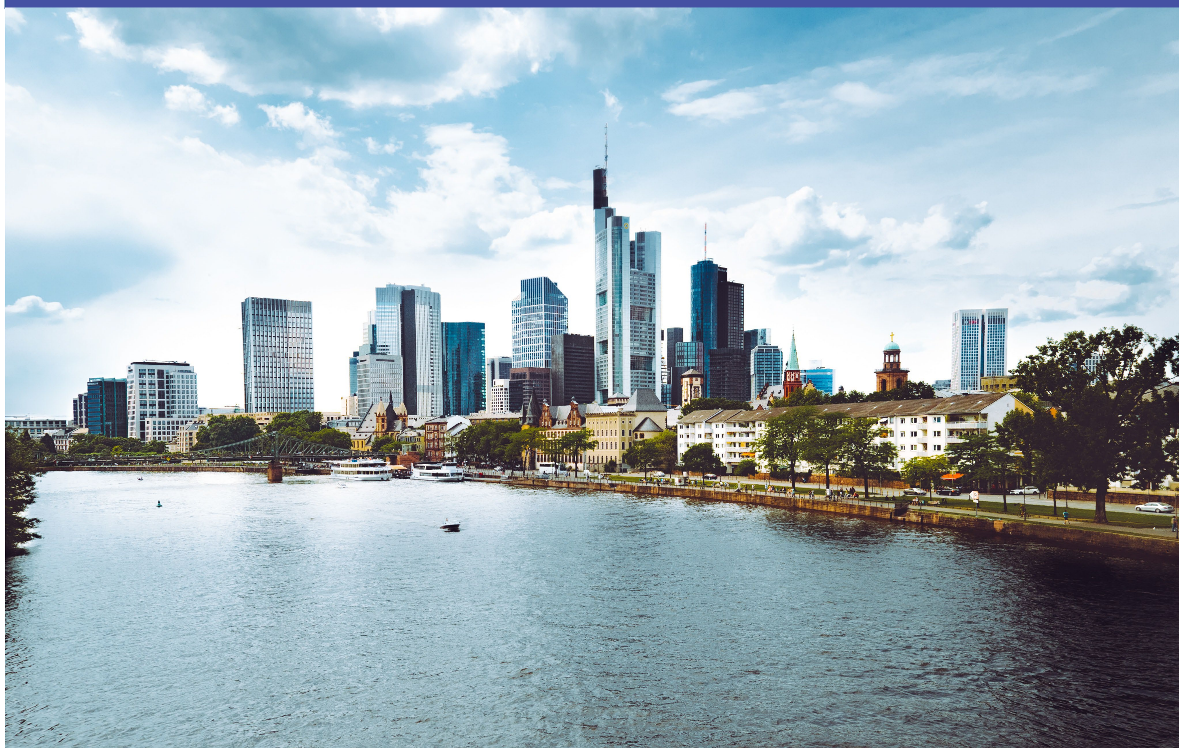
Image, libre de droit, Francfort.

Investir dans l'immobilier d'entreprise sur le Continent européen pour une épargne diversifiée Horizon de placement recommandé : 8 ans